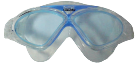
GAF A BRÉTEMA