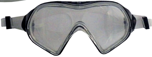
GAF A ARIEL